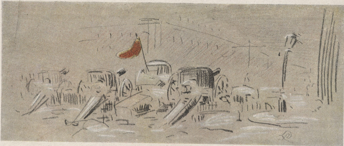
Une barricade dressée devant l'Ambassade de France à Petrograd.