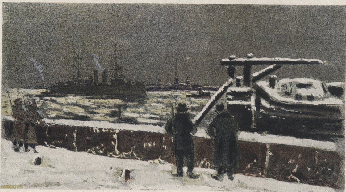
Entrée de la Canonnière bolchevik " Kikinetz " dans le port de Petrograd

Tout le monde pensait que ces mesures énergiques avaient définitivement rétabli l'ordre et les chefs de la révolution constataient le soir que la partie était perdue pour eux. Les troupes tenaient la ville dans un filet de fer; à chaque carrefour les rares passants qui revenaient du théâtre à pied — car la circulation en voiture était interdite — étaient arrêtés par des postes de soldats bivouaquant autour de grands feux. Des patrouilles de cosaques passaient dans les rues feutrées de neige au seul bruit des chevaux mâchant leur mors et du cliquetis des