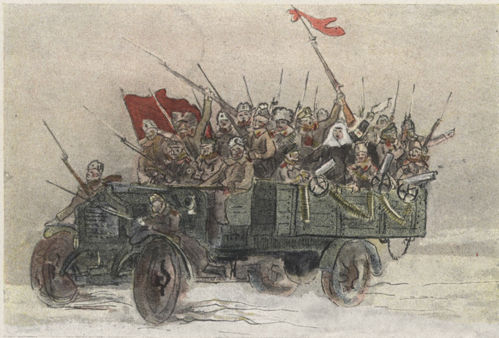
Un Camion révolutionnaire.

Le lendemain (12 mars) tout paraissait tranquille. On parlait d'une reprise partielle du travail et les milieux officiels escomptaient la nouvelle de la prise de Bagdad par les Anglais pour calmer définitivement les esprits. Mon impression favorable se confirmait encore en voyant à 10 heures un régiment passer superbe avec ses hommes tous pareils, alignés d'une manière impeccable, portant le fusil baïonnette au canon haut sur l'épaule, l'allure martiale et fière... Il avait à peine achevé de défiler qu'on m'annonce qu'une collision vient de se produire entre les troupes et un groupe de grévistes venu pour débaucher les ouvriers de l'arsenal... Je cours sur les lieux... On dit qu'on tire et je rencontre des gens qui courent et cherchent à se cacher. J'entends en effet quelques détonations et, arrivé sur la perspective Liteing, devant l'arsenal, je me trouve dans un grouillement de soldats en désordre. Des coups de feu partent de tous côtés mais je ne vois pas de victimes. Quelques camions automobiles passent, chargés de soldats avec des petits fanions rouges que je prends pour des fanions de service. On crie un peu plus sur leur passage... Puis c'est une fuite éperdue, tous les soldats courent en jetant leur fusil... La révolution est faite.