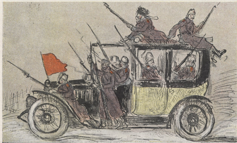
Automobile d'une noble dame de Petrograd utilisée par les soldats.

Une heure après la soldatesque arrête les officiers et arrache leurs insignes, on pille et on incendie les monuments publics ou les habitations des personnages en vue du régime, on ouvre les portes des prisons dont les criminels se répandent dans la ville. Il n'y a plus un agent, plus un vestige d'ordre. Le régiment que j'ai vu défilé deux heures plus tôt repasse en troupeau lamentable, méconnaissable. Les hommes sont débraillés, portent leurs armes sous le bras ou la crosse en l'air beaucoup traînent derrière eux sur la neige au moyen de ficelles des caisses remplies d'objets hétéroclites... ce ne sont plus les soldats magnifiques de tout à l'heure ce sont les towarichs dépenaillés dont l'image obsède tous ceux qui ont connu la Russie depuis la chute de l'Empire.