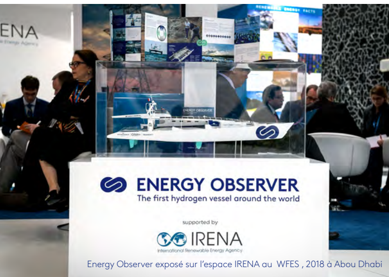
Energy Observer exposé sur l'espace IRENA au WFES, 2018 à Abou Dhabi