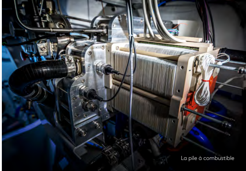
La pile à combustible

L'hydrogène est l'élément chimique le plus abondant de l'Univers. Inépuisable, il présente une densité énergétique exceptionnelle : il libère jusqu'à 4 fois plus d'énergie que le charbon, 3 fois plus que le gazole et 2,5 fois plus que le gaz naturel. Sa combustion n'émet ni gaz à effet de serre, ni particule fine. Son potentiel est donc immense et, dans la transition énergétique, il ouvre un champ des possibles considérable ! Mais comme il est le plus souvent combiné à d'autres éléments, il faut apprendre à l'en extraire à moindre coût et de manière décarbonée, c'est-à-dire sans utiliser d'énergie fossile.