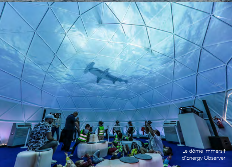
Le dôme immersif d'Energy Observer

Mis à la disposition de nos partenaires, le village devient un lieu de rencontre et d'échanges autour de nos ambitions partagées en faveur de la transition écologique.