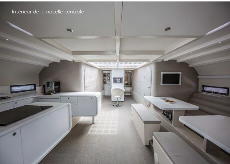
Intérieur de la nacelle centrale

Energy Observer est ainsi le premier navire au monde capable de produire son hydrogène à bord, via l'électrolyse de l'eau de mer. En réalisant un tour du monde autonome grâce à ce système énergétique inédit, nous voulons démontrer les performances de l'hydrogène auprès des décideurs, des entreprises et des citoyens, afin de favoriser son déploiement à grande échelle dans les décennies à venir.