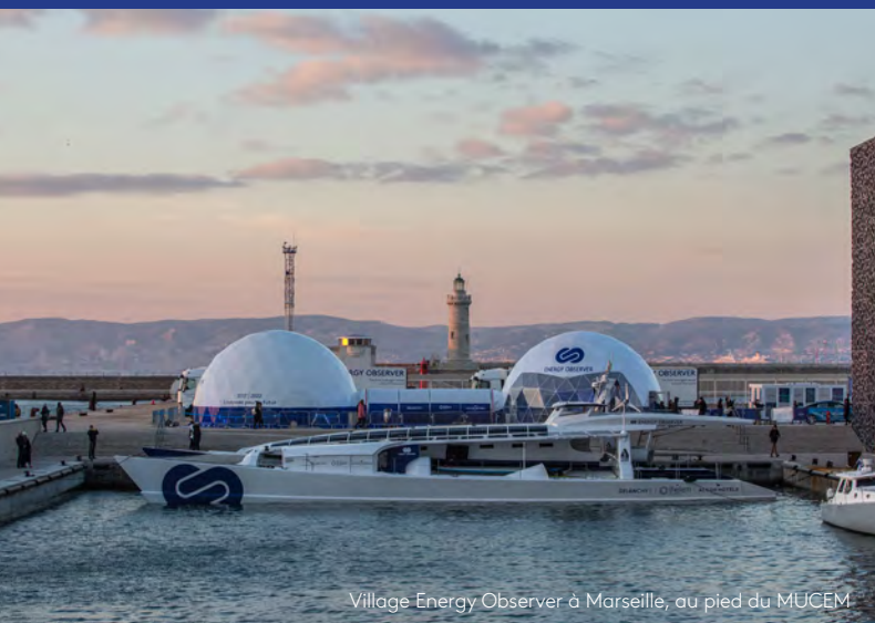
Village Energy Observer à Marseille, au pied du MUCEM

Lors des principales escales, Energy Observer déploie un village destiné à accueillir le public gratuitement pour lui faire vivre une expérience unique. Grâce à une exposition interactive, de la réalité virtuelle et des projections à 360°, il constitue une véritable fenêtre sur le futur. Lors des 8 escales du Tour de France, ce sont déjà 100 000 visiteurs qui ont pu découvrir l'Odyssée pour le futur.