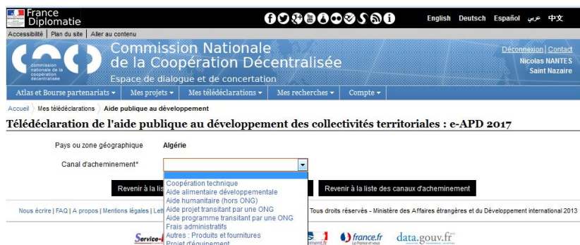
Fig. 3 : Sélectionner le canal d'acheminement par lequel transite votre APD vers ce pays (vous pouvez en sélectionner autant que nécessaire en cliquant sur le « + »).