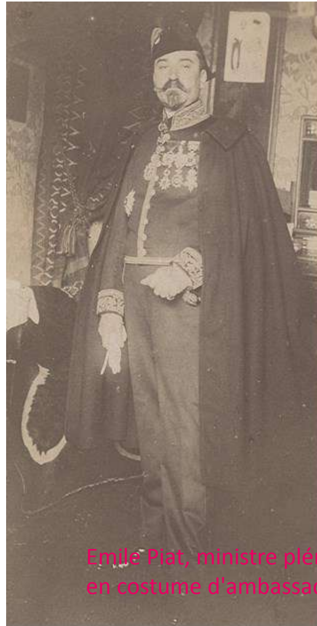
Emile Plat, ministre plénipotentiaire, en costume d'ambassadeur, 1870

Les premières ambassades permanentes sont créées au XVIe siècle