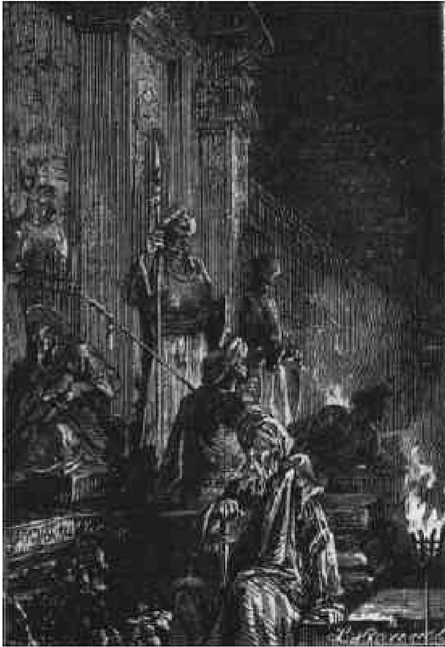
Les gardes des rajahs, éclairés par des torches...