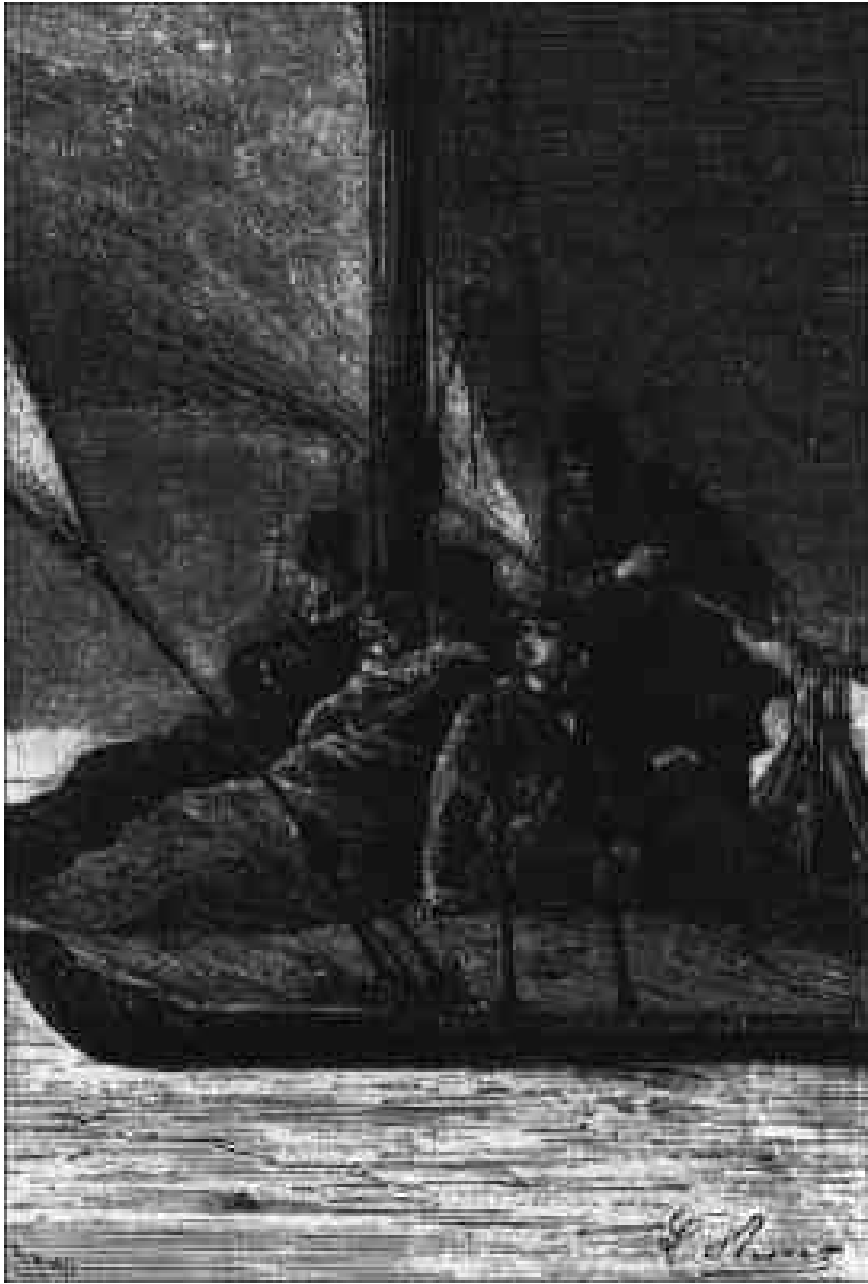
Les voyageurs, pressés les uns contre les autres...