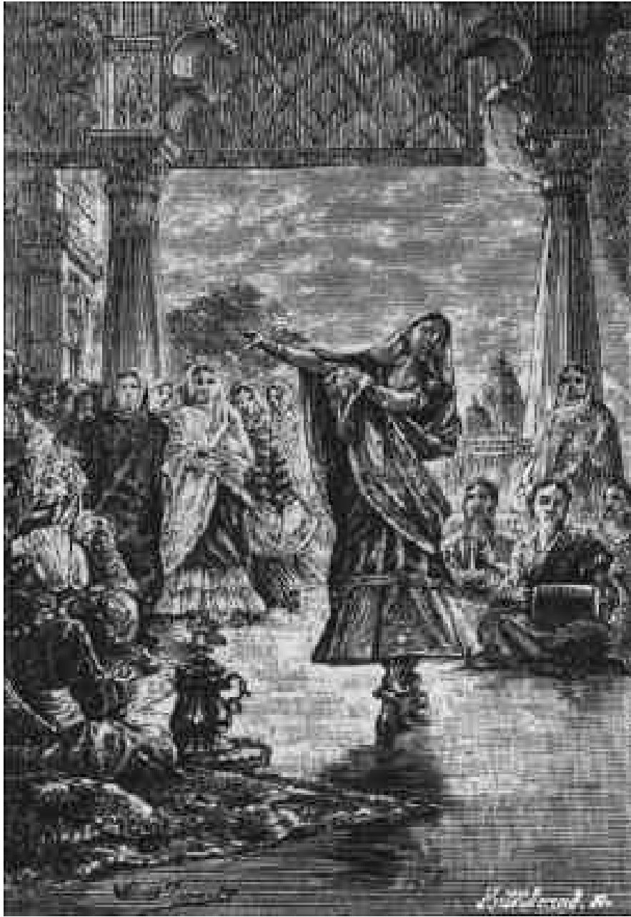
Les bayadères à Bombay.