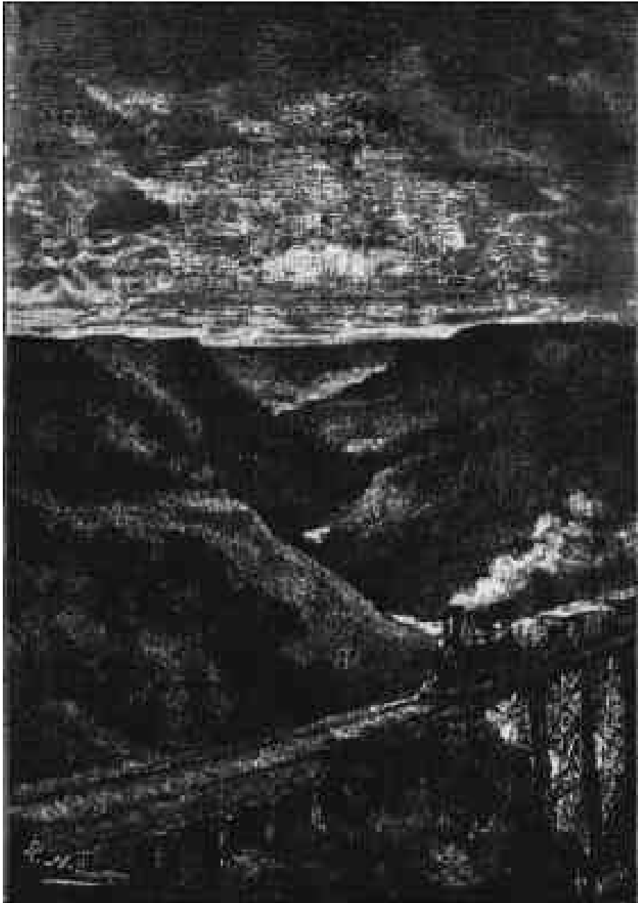
Le rail-road atteignait le plus haut point de son parcours.