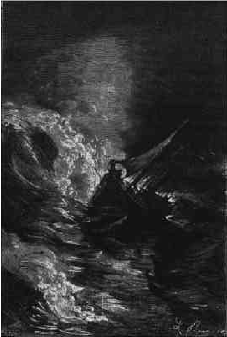
La Tankadère fur enlevée comme une plume.