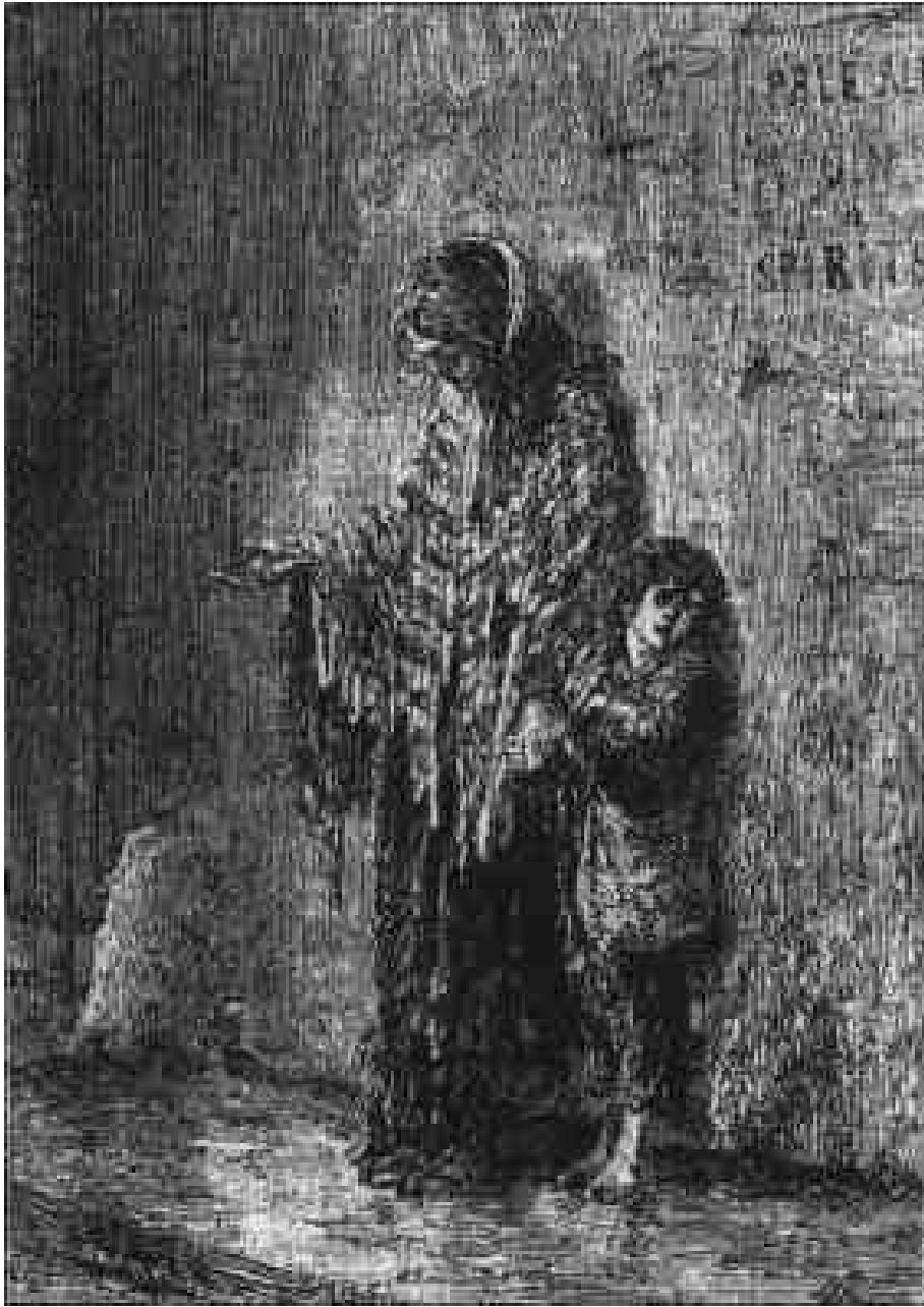
Une pauvre mendiante.