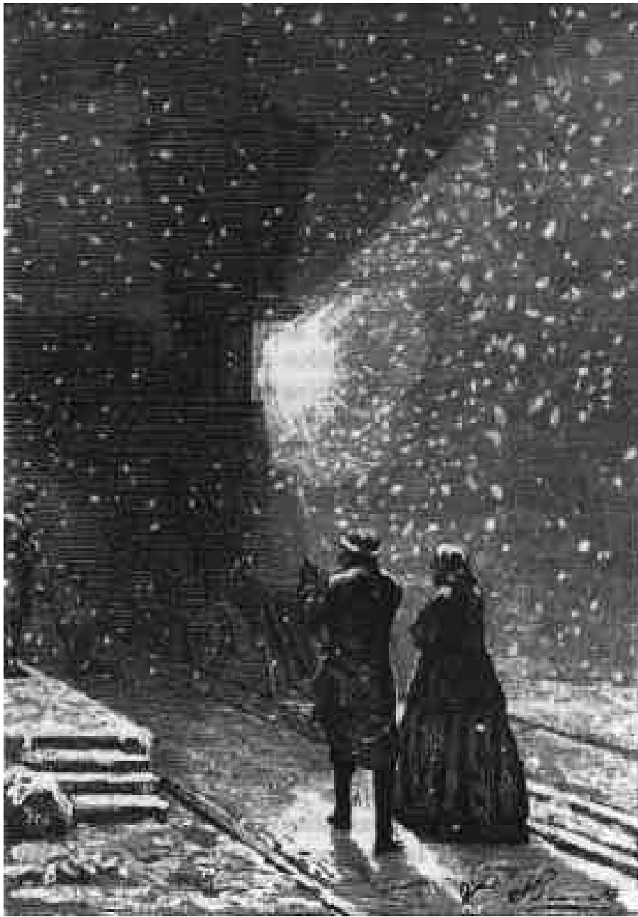
Une énorme ombre, précédée d'une lueur fauve.