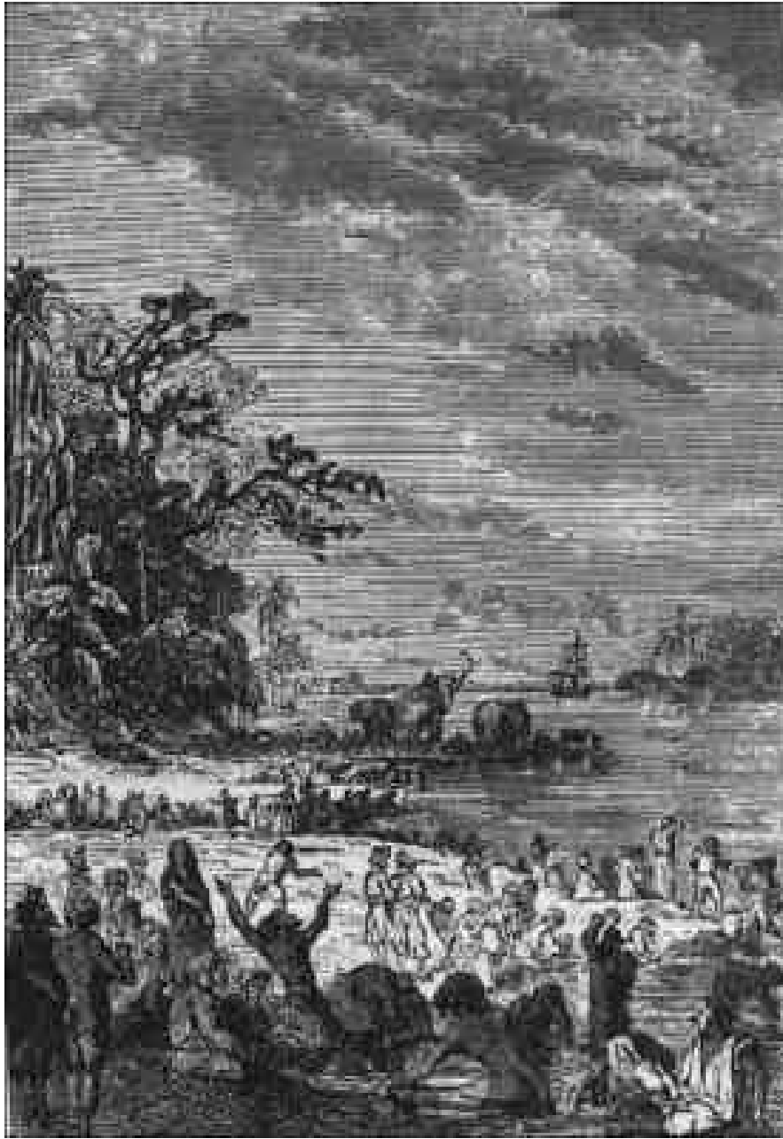
Des bandes d'indous des deux sexes.