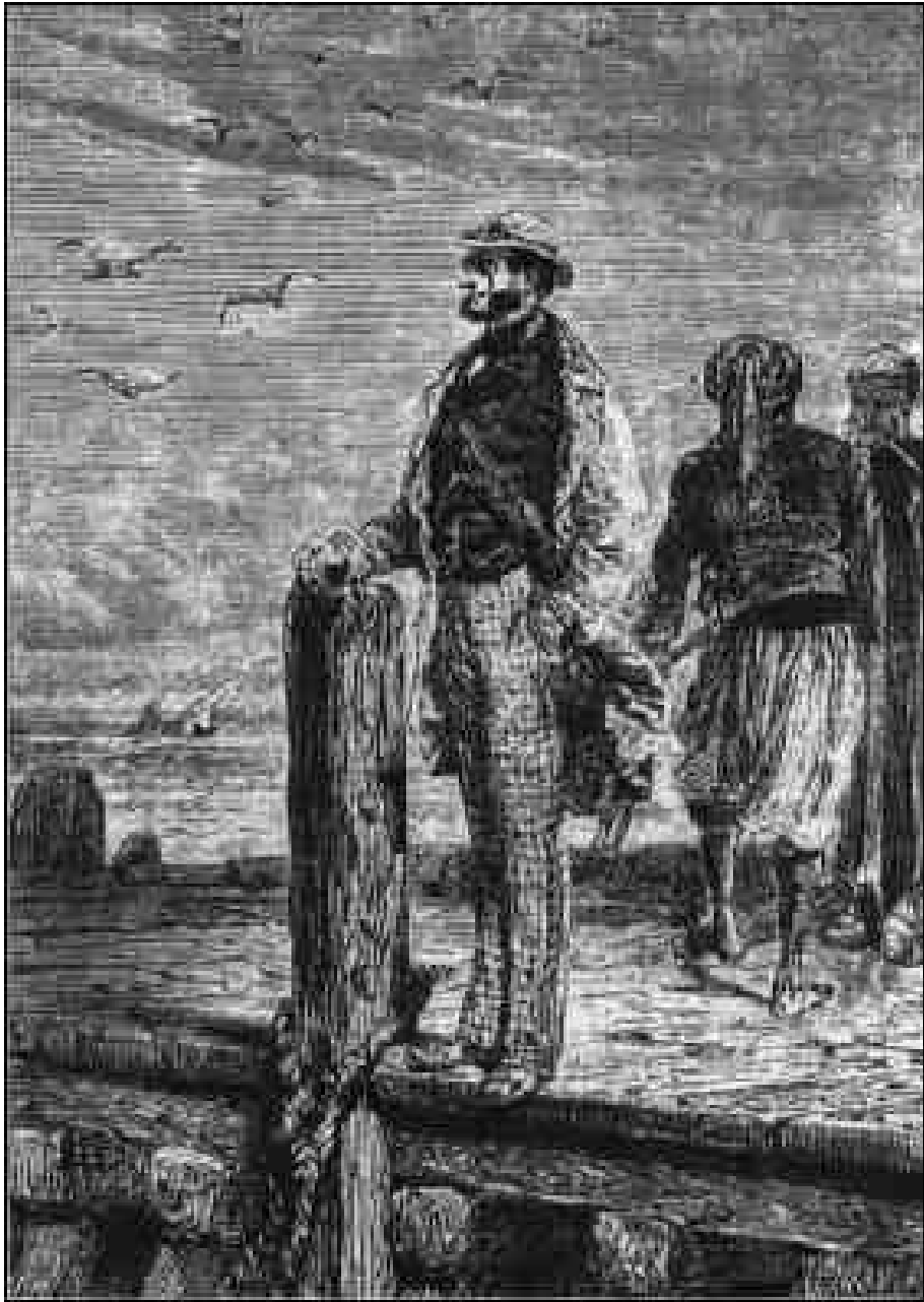
L'inspecteur de police.